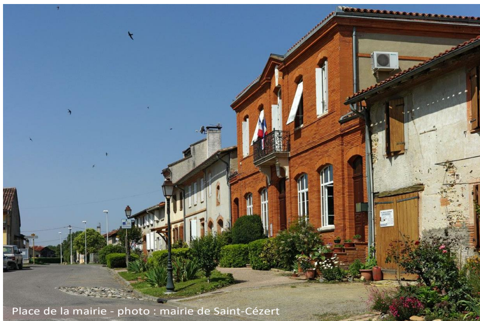
Place de la mairie